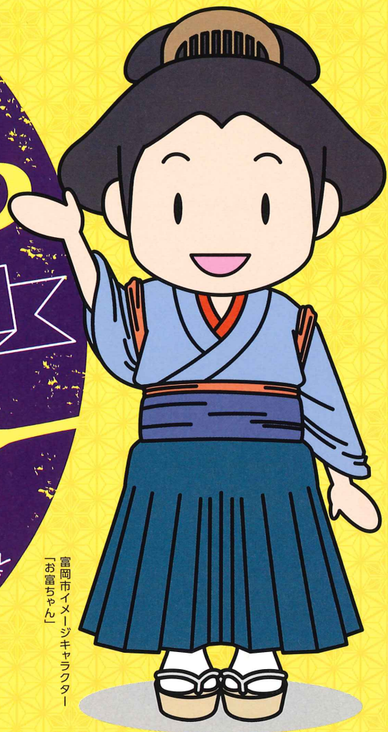
富岡市イメージキャラクター 「お富ちゃん」