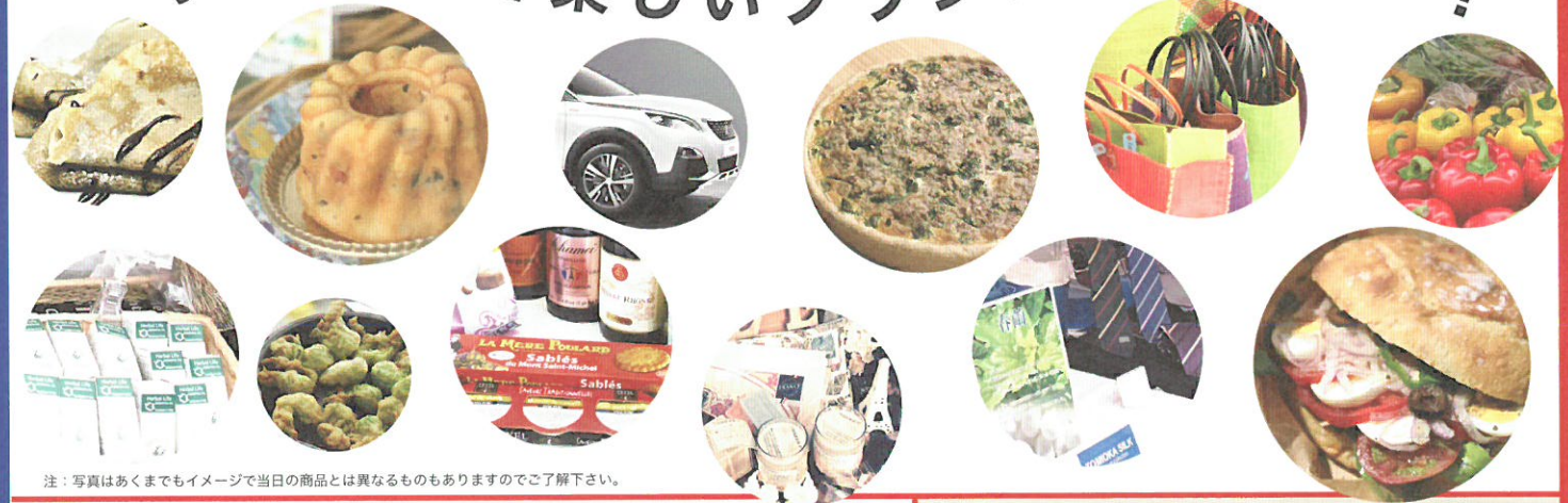
注：写真はあくまでもイメージで当日の商品とは異なるものもありますのでご了解下さい。