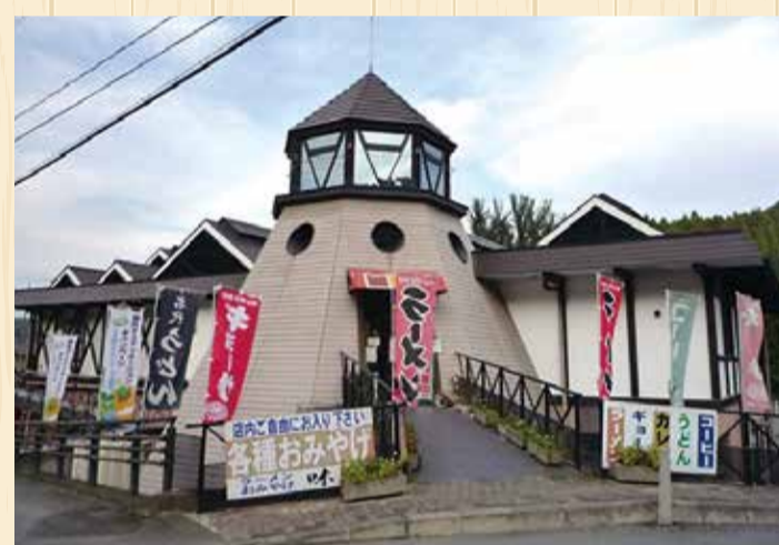
3 道の駅 万葉の里