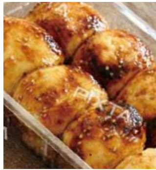
上州名物焼きまんじゅう