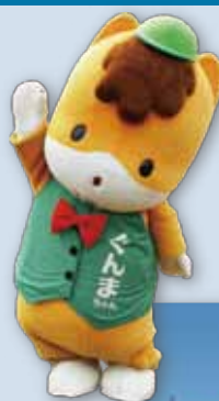
群馬県のマスコット ぐんまちゃん

上州名物焼きまんじゅう / 那須庵の手打ち蕎麦 / うどん・パスタ / 焼き鳥、焼きそばなどの屋台の味 / かき氷 / 生ビール / アイスcream / スイーツ 等