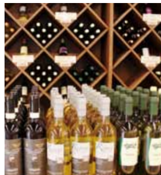
チェルタルドからの直輸入ワイン