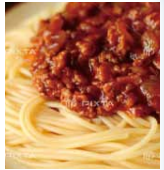
コルノマカロニの Pasta