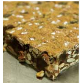
伝統菓子パンフォルテ