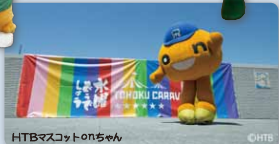
HTBマスコットonちゃん