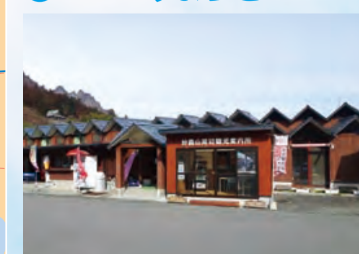
回道の駅 みょうぎ