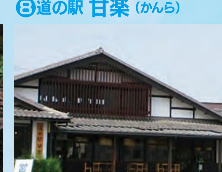
回道の駅 甘楽 (かんら)