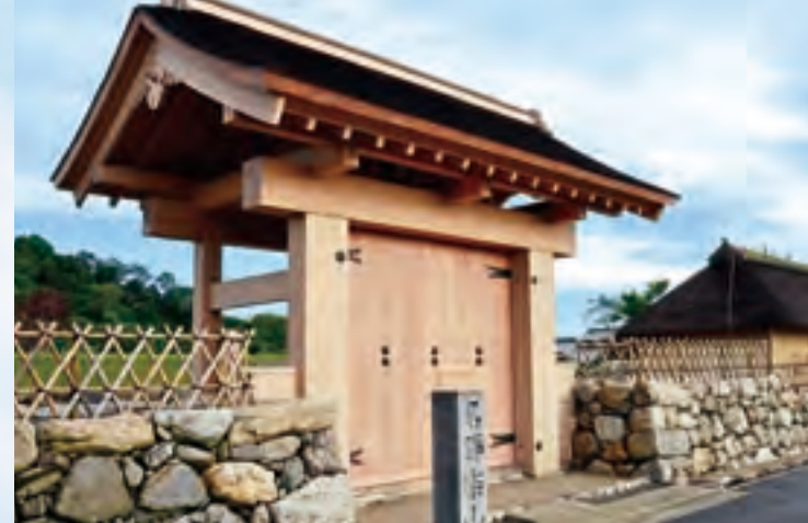
回楽山園 (らくさんえん)