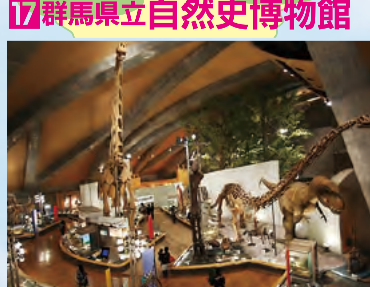
回群馬県立自然史博物館