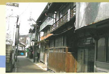
9 中央銀座通り 昔なつかしい昭和レトロにタイムスリップし た通り。花街の面影を残す諏訪神社参道。