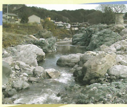
7 青岩公園 公園に広がる青い岩置は、 三波川結晶片岩類に分類さ れる岩石です。