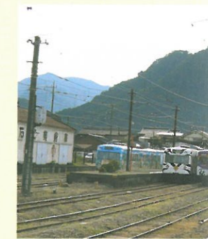
13 下仁田駅 1897年(明治30年)9月開 終着駅。関東の駅百選。 観光・お買い物等に無料 ご利用できます。