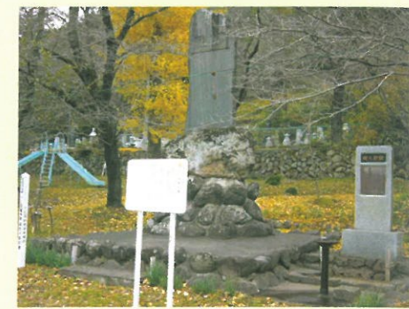
11 義烈千秋の碑 「義烈千秋」は小松宮彰仁親王の書。碑文 依田百川。